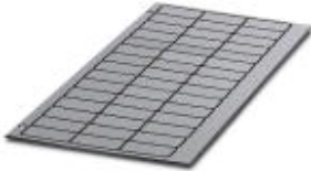
The figure shows the version GPE 27x12,5 SR/R

Engraving material, Sheet, silver, unlabeled, can be labeled with: Engraving, Plotter, Mounting type: Adhesive, Lettering field: 28 x 17.5 mm