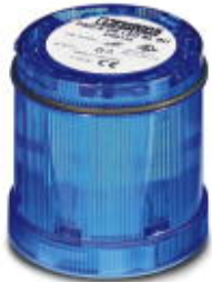
LED blinking light element, 24 V AC/DC, blue

Please be informed that the data shown in this PDF Document is generated from our Online Catalog. Please find the complete data in the user's documentation. Our General Terms of Use for Downloads are valid ( http://phoenixcontact.com/download )