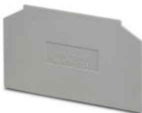
Partition plate, Length: 69 mm, Width: 1.5 mm, Height: 57 mm, Color: gray

Please be informed that the data shown in this PDF Document is generated from our Online Catalog. Please find the complete data in the user's documentation. Our General Terms of Use for Downloads are valid ( http://download.phoenixcontact.com )