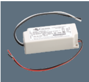
Class 2 Power Supply 12W Califa Lighting Part # - PS-1032

PRODUCT DETAILS For hardwiring with track systems, this Power Supply is best Suited for use with single track segments with lower wattage luminaires.