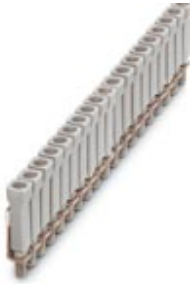
Jumper, Number of positions: 100, Color: gray

Please be informed that the data shown in this PDF Document is generated from our Online Catalog. Please find the complete data in the user's documentation. Our General Terms of Use for Downloads are valid ( http://download.phoenixcontact.com )