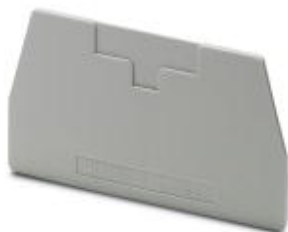
End cover, Length: 72 mm, Width: 2.2 mm, Height: 41.5 mm, Color: gray

Please be informed that the data shown in this PDF Document is generated from our Online Catalog. Please find the complete data in the user's documentation. Our General Terms of Use for Downloads are valid ( http://download.phoenixcontact.com )