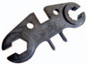
Field Tool - multiple functions, PN 1971903-1