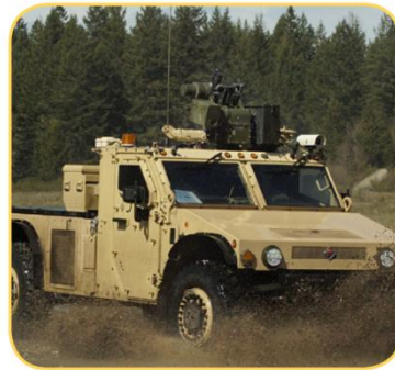
Unmanned Vehicle Control

The VG440 combines highly-reliable MEMS gyros and accelerometers with high-speed DSP electronics to provide a fully stabilized vertical gyroscope in a small and rugged environmentally-sealed enclosure. The VG440 provides consistent performance in challenging operating environments and is user-configurable for a wide variety of applications