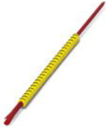
Conductor marking collar, Labeled with the number: 0, white

Please be informed that the data shown in this PDF Document is generated from our Online Catalog. Please find the complete data in the user's documentation. Our General Terms of Use for Downloads are valid ( http://phoenixcontact.com/download )