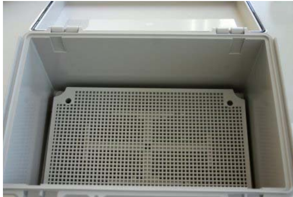
Click on Image for Larger View

An all plastic accessory panel used with the NBF series NEMA boxes that allows easy mounting of electronic devices in the box