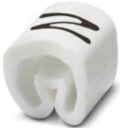
Conductor marking collar, labeled with the capital letter: Letters, white, width: 3.2 mm

Please be informed that the data shown in this PDF Document is generated from our Online Catalog. Please find the complete data in the user's documentation. Our General Terms of Use for Downloads are valid ( http://phoenixcontact.com/download )