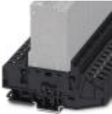
Modular socket element, 2-position, for holding two circuit breakers, each with a single position

Box mounting base - TMCP SOCKET M - 0916589