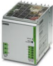
DIN rail power supply unit, primary-switched, 1-phase, input: 600 V DC; output: 24 V DC/20 A

Please be informed that the data shown in this PDF Document is generated from our Online Catalog. Please find the complete data in the user's documentation. Our General Terms of Use for Downloads are valid ( http://phoenixcontact.com/download )