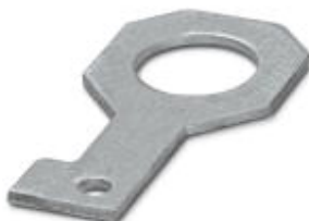
Plate for fixing the FLT-ISG-100-EX isolating spark gap to a flange, drill hole diameter of 42 mm.

Please be informed that the data shown in this PDF Document is generated from our Online Catalog. Please find the complete data in the user's documentation. Our General Terms of Use for Downloads are valid ( http://phoenixcontact.com/download )