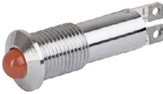
Housing chrome LED red Without pre-resistor with exposed LED and external reflector