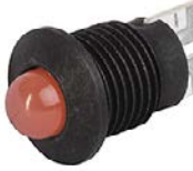
Housing black dull LED red Exposed LED and external reflector