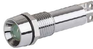
Housing chrome LED green Chalice shape with internal reflector