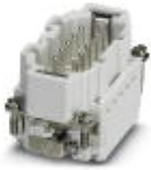
HEAVYCON male insert, B10 series, 10-pos., push-in connection

Contact insert - HC-B 10-I-DT-M - 1648199